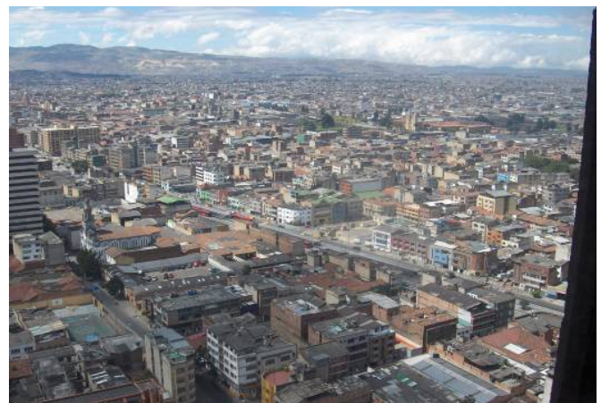
Figura 9: Fotografia aérea do setor categorizado

Atualmente, o governo de Bogotá, em colaboração com agentes públicos e privados, empreende ações orientadas à recuperação do setor, em especial um plano de zoneamento do centro da cidade, com o objetivo de recuperar o CBD. Busca-se torná-lo atrativo para agentes que no passado se deslocaram para outras áreas da cidade por comodidade, segurança ou para a obtenção de maiores rendimentos (Figura 9).