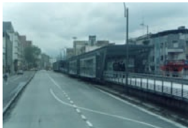
Figura 4: Estação da Rua 22 com acesso na Rua 20 e 22

SE ou ALUGA-SE. Situação totalmente inesperada depois da revitalização da via, do sistema dos calçadões e do investimento de aproximadamente 3,8 milhões de dólares (valores de 2000) por quilômetro construído de infra-estrutura viária da primeira fase do sistema Transmilênio.