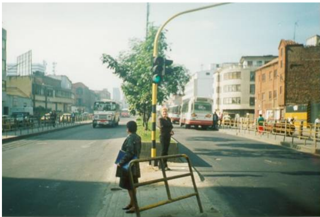
Figura 1: Antiga Avenida Caracas (foto sentido Norte-Sul)

conduziriam a seu destino. Esse novo sistema foi batizado Transmilênio, e tornou-se internacionalmente conhecido na área de transportes.