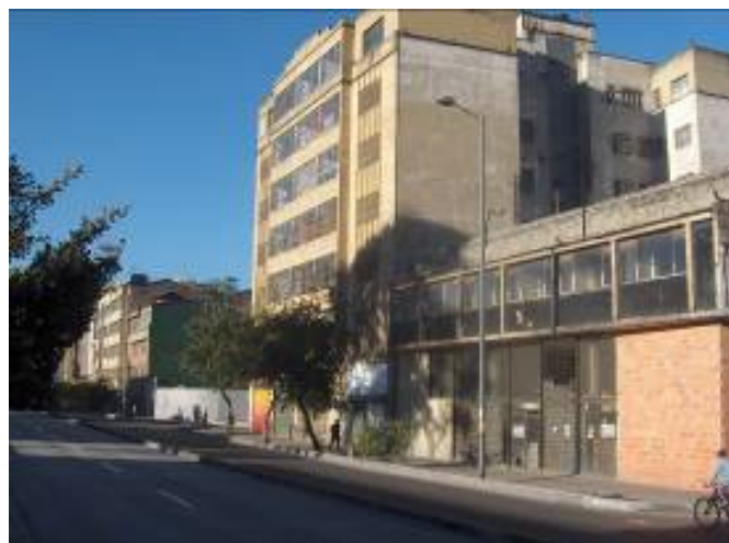
Figura 5: Imóveis desocupados junto ao Transmilênio

As seguintes fotografias de autoria de Johann Dilak Julio Estrada (Figuras 5 a 8) mostram o que acontece no setor compreendido entre as Ruas 26 e 19, ao longo do eixo da Avenida Caracas.