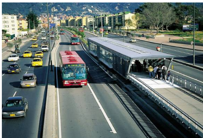
Figura 3: Sistema de estações do novo sistema Transmilênio

no setor – fossem alijadas do sistema, uma vez que a lógica da rede agora limita o acesso às estações e não vincula o acesso aos ônibus com o calçadão mais próximo, ou seja, com a vida comercial do setor.