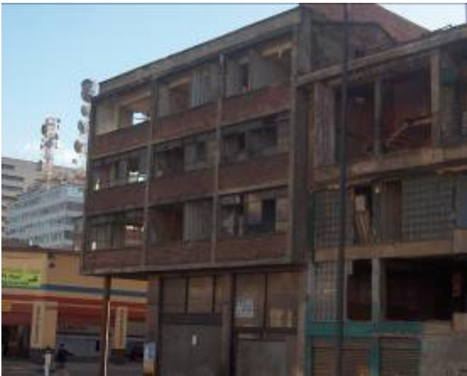
Figura 6: Imóveis inacabados junto ao Transmilenio