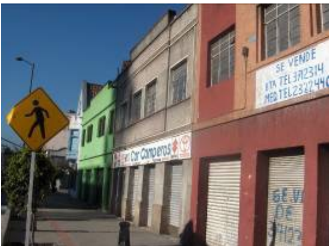
Figura 7: Imóveis desocupados à venda junto ao Transmilenio