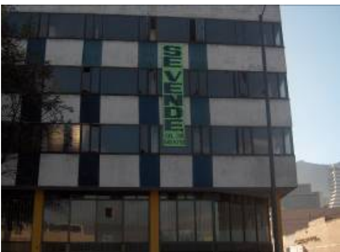
Figura 8: Imóveis desocupados à venda junto ao Transmilenio

Os vazios urbanos proliferam no setor e não são poucas as construções em total estado de abandono e deterioração. Podemos observar igualmente antigas lojas de autopeças em geral fechadas, que servem como bodegas ou simplesmente sem nenhum uso aparente.